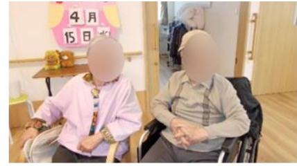
ご夫婦でツーショット☆