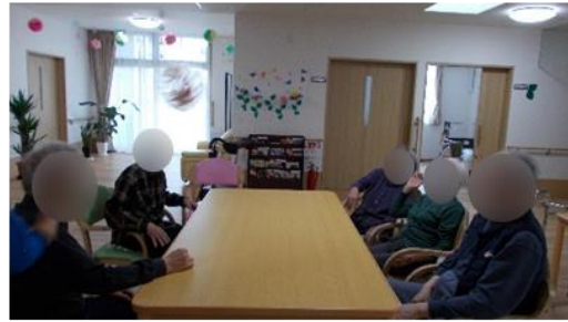
数合わせに取り組みられています