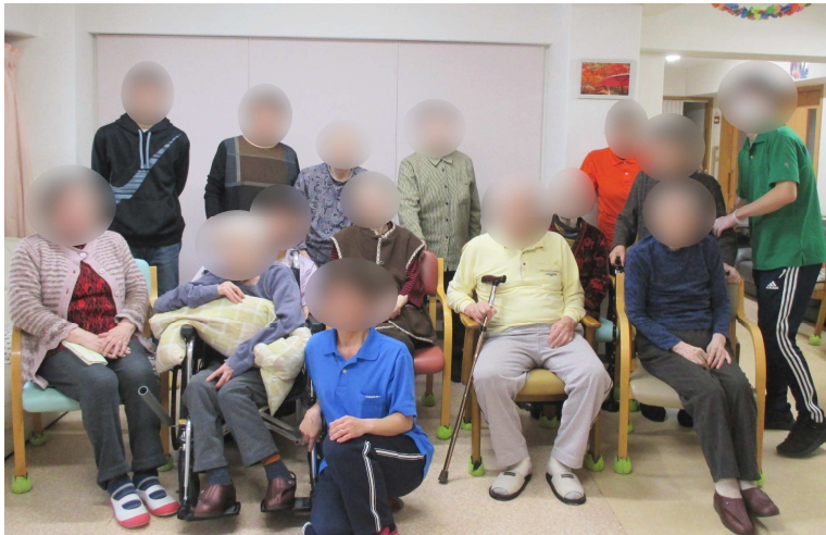
※職員は写真撮影の為マスクを外しています

コロナウイルス感染拡大防止により、 面会を自粛して頂いておりますが、 皆様発熱等なく元気にお過ごしです☺