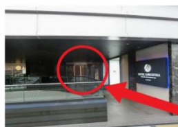
自動ドアを入れて右手にエレベーターがあります