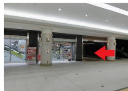
← の方向に進み ○ の自動ドアへ