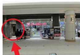
ここを入れて左手にエレベーターがあります