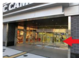
自動ドアを入れて右手にエレベーターがあります